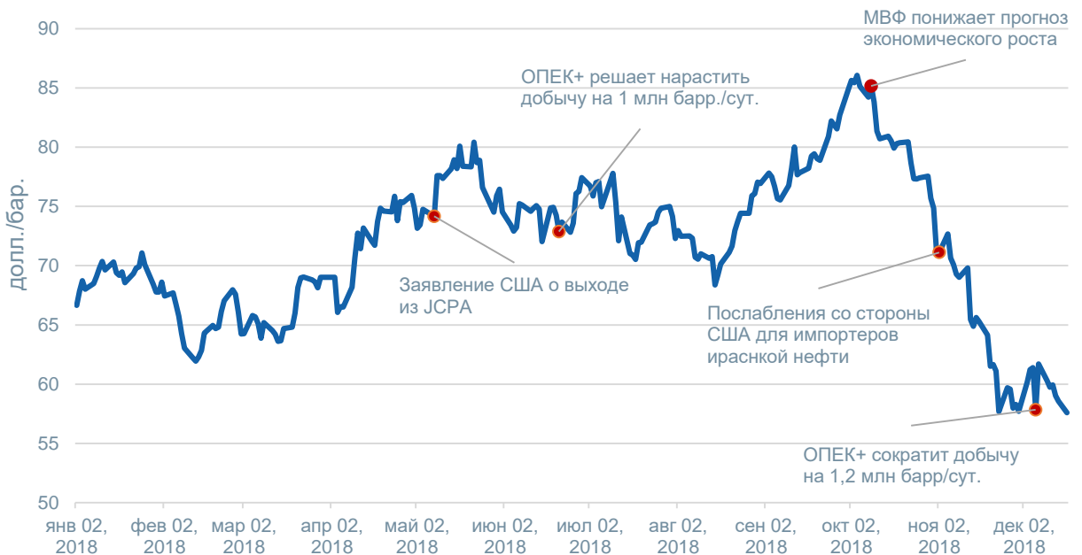
Рисунок 2. Цена нефти Brent

В последние несколько недель на рынке преобладают медвежьи настроения. Цена на нефть марки Brent упала с 86 долл./барр. в начале октября до 50 долл./барр. в декабре с возвратом до 55. Чем же вызвано текущее снижение цен?